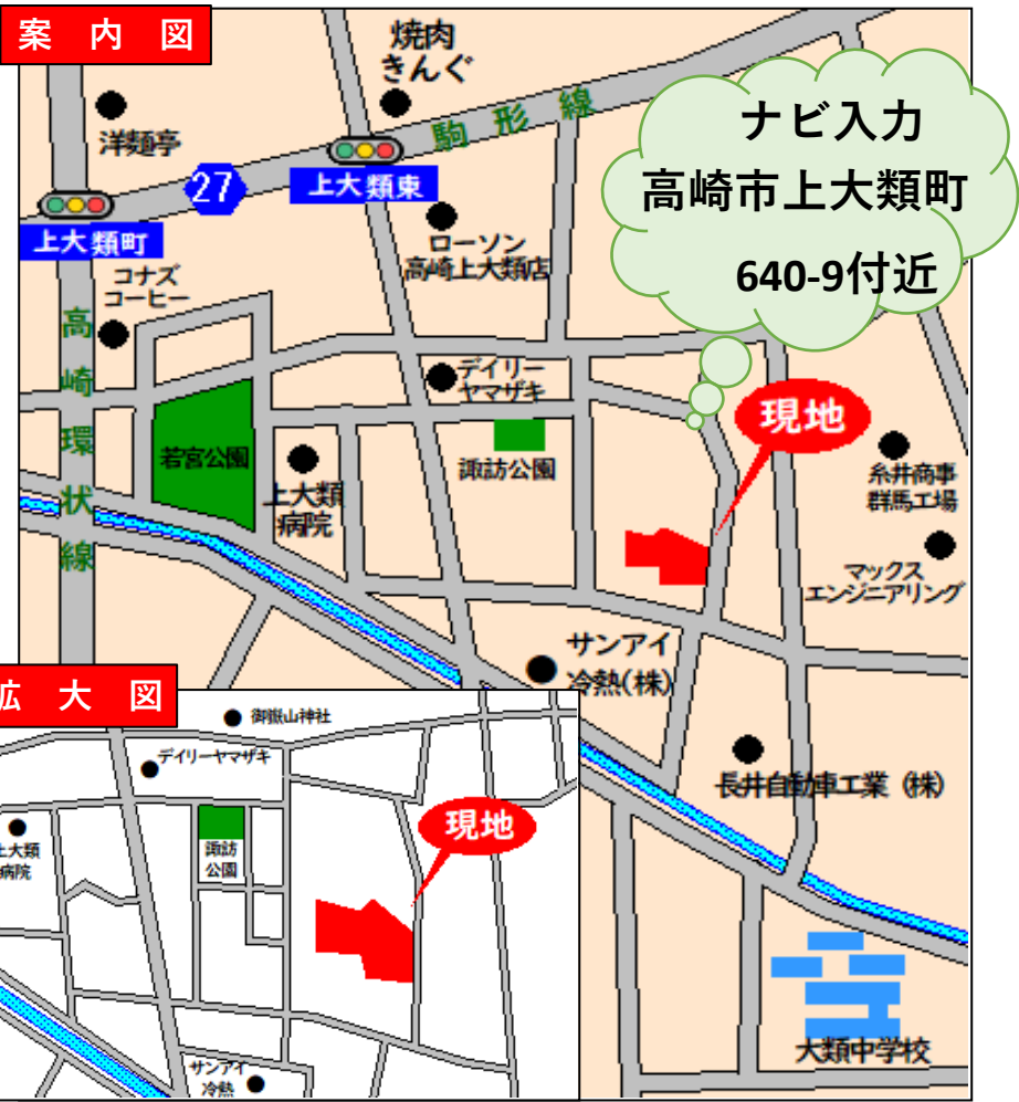
案 内 図